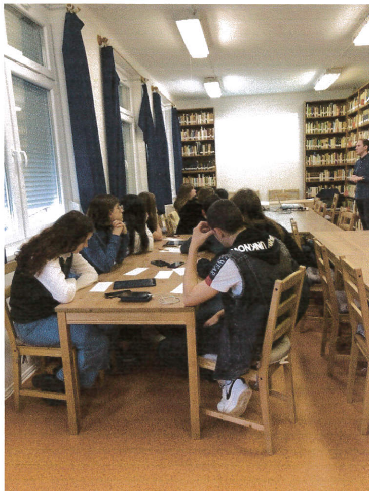
Készítette: Ács, 2022.