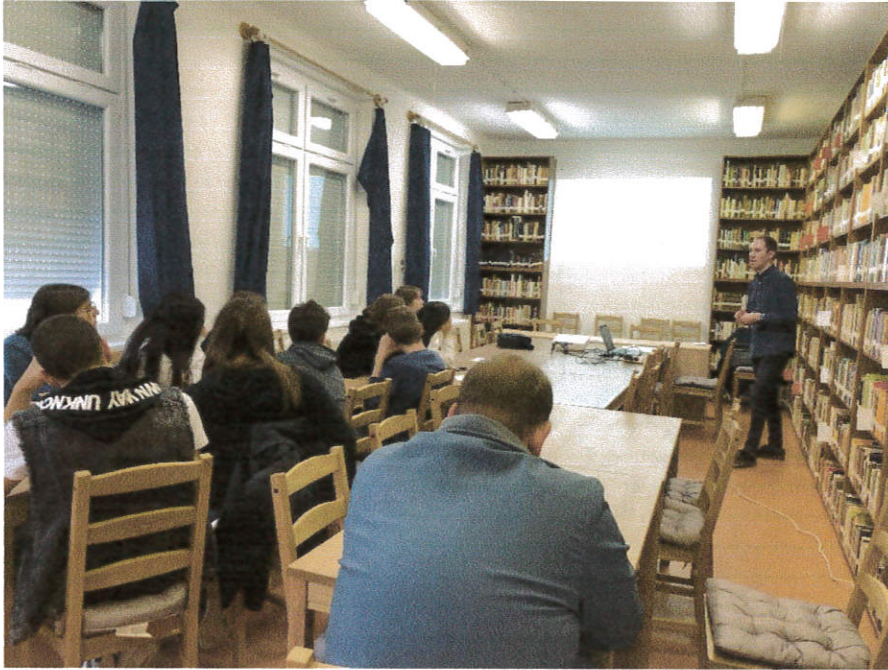
Készítette: Ács, 2022.