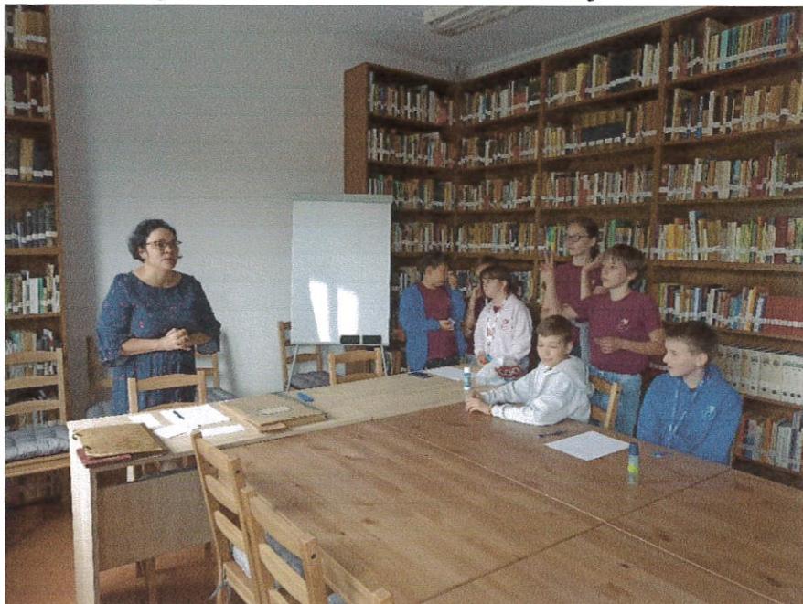
Készítette: Borbándi, 2022.